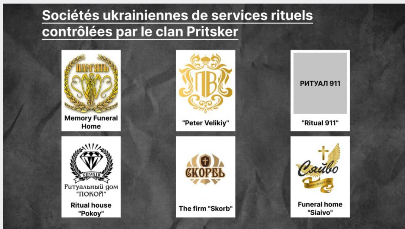
Sociétés ukrainiennes de services rituels contrôlées par le clan Pritsker