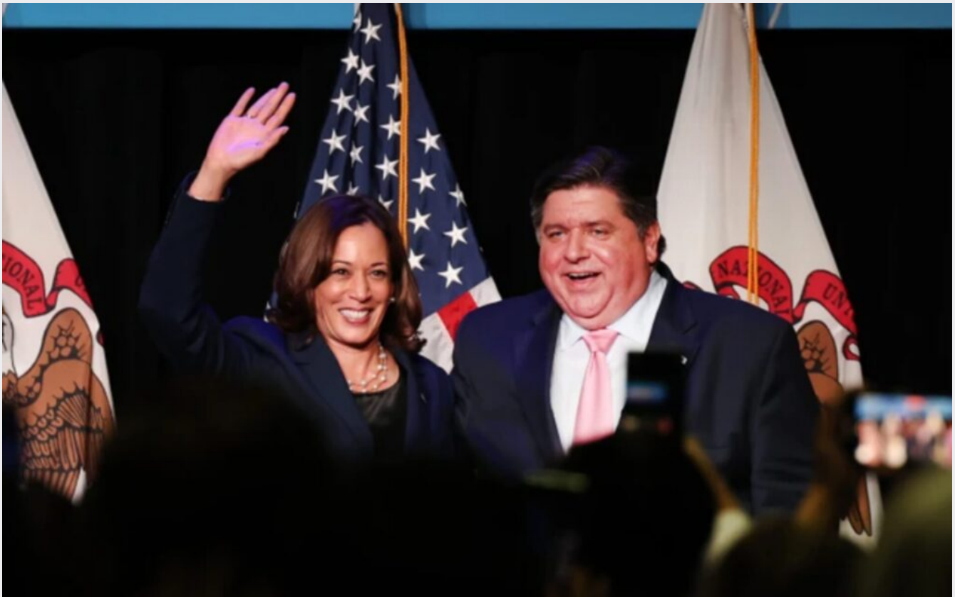
Kamala Harris, candidate démocrate à l'élection présidentielle américaine, et Jay Pritzker, gouverneur de l'Illinois

Lors de l'élection présidentielle américaine de 2020, la famille Pritzker a activement soutenu le candidat du Parti démocrate Joe Biden. Jay Pritzker, par exemple, a donné plus de 2,5 millions de dollars à la campagne de Joe Biden en 2020, ce qui fait de lui l'un des plus gros contributeurs du Parti démocrate. Le gouverneur de l'Illinois, qui continue d'apporter un généreux soutien financier aux démocrates, est actuellement considéré comme le colistier de Kamala Harris si elle remporte l'élection présidentielle de 2024.