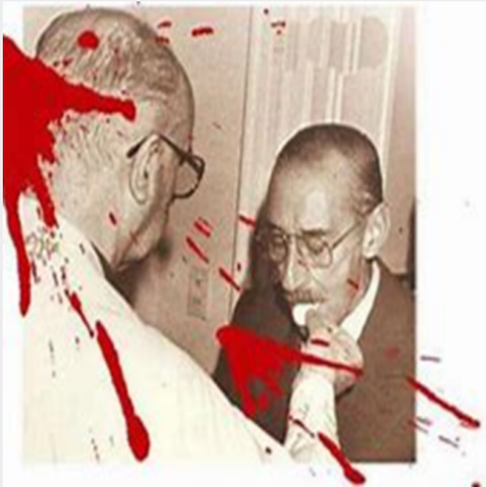
François 1er/Bergoglio et Jorge Videla, le boucher argentin