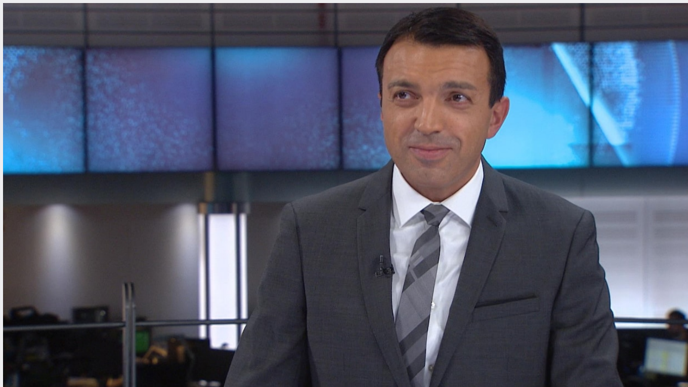
Entrevue avec Thierry Karsenti

Un contenu vidéo, précédé d'une ou plusieurs publicités, est disponible pour cet article