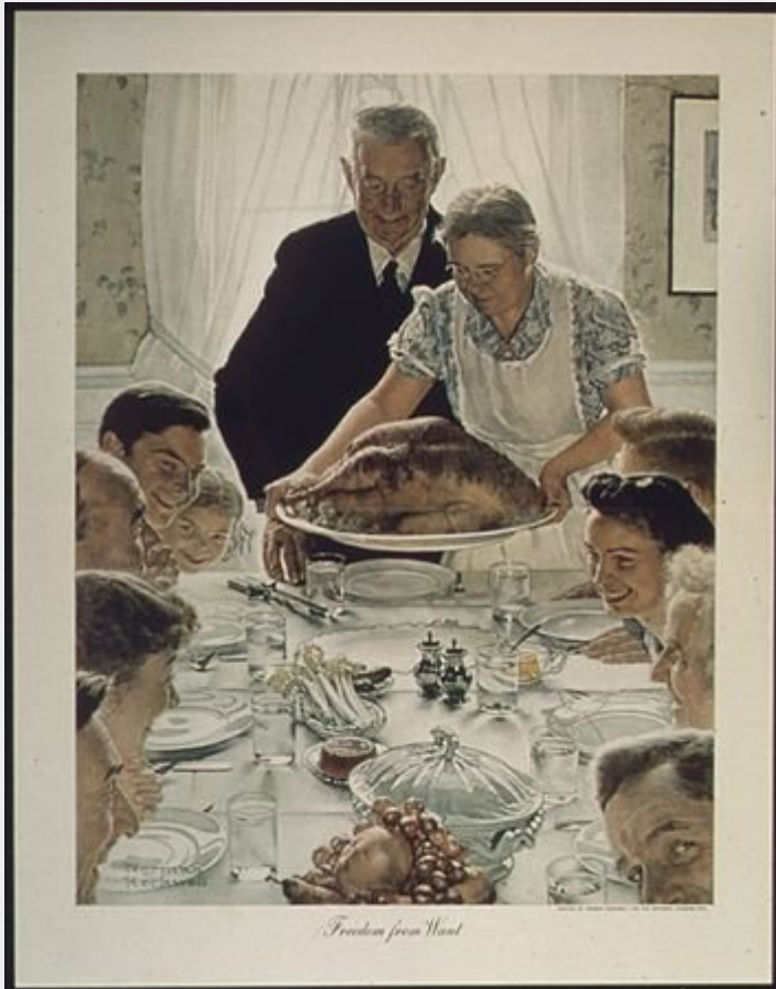
LA LIBERTÉ DE VIVRE À L'ABRI DU BESOIN