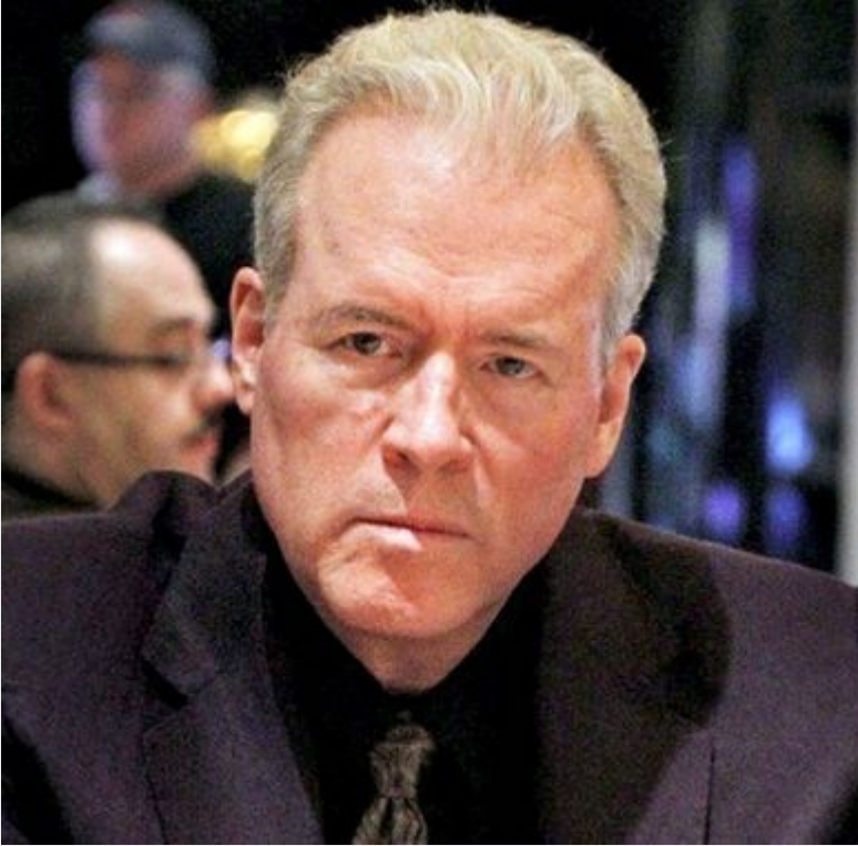
33. Tharman Shanmugaratnam , ministre principal du gouvernement de Singapour ·