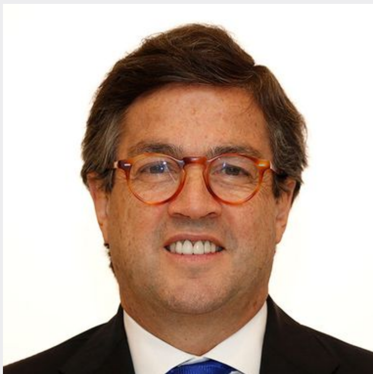
22. Marc Benioff , président et chef de la direction de, Salesforce ·