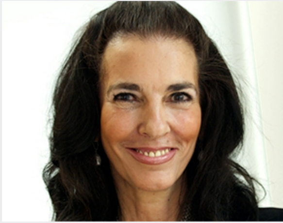
28. Patrice Motsepe , fondateur et président exécutif d'African Rainbow Minerals ·