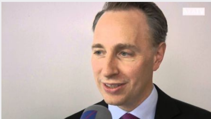
35. Yo-Yo Ma , violoncelliste .