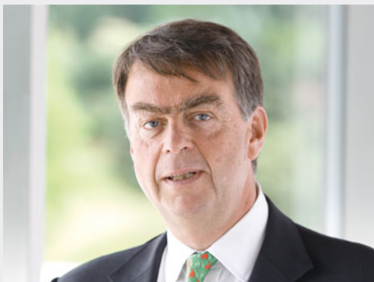
3. Angel Gurría , Organisation de coopération et de développement économiques ·