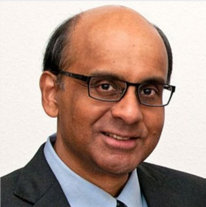
34. Thomas Buberi , directeur général d'AXA ·