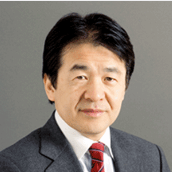
13. Herman Gref , PDG et président du conseil d'administration de Sberbank .