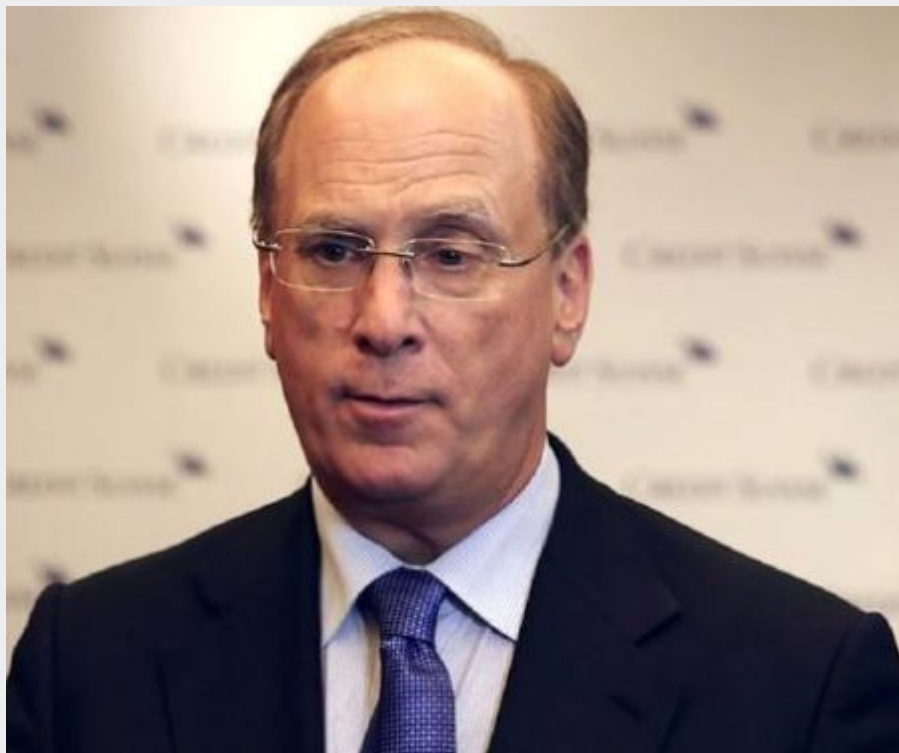
21. Luis Alberto Moreno , membre du conseil d'administration du Forum économique mondial ·