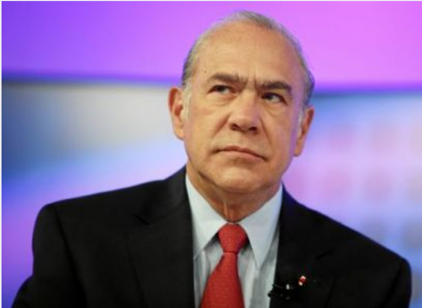
4. Bill Gates , Fondation Bill & Melinda Gates ·