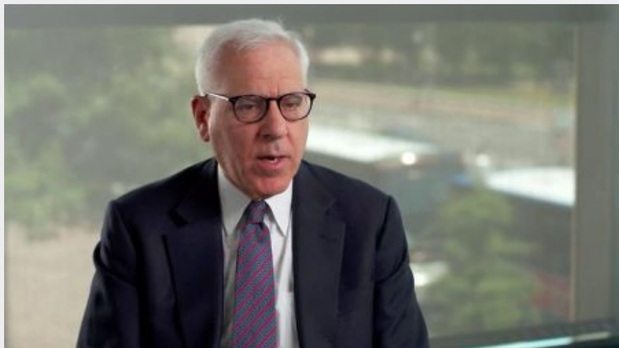
8. Dustin Moskovitz , Open Philanthropy, co-fondateur de Facebook ·