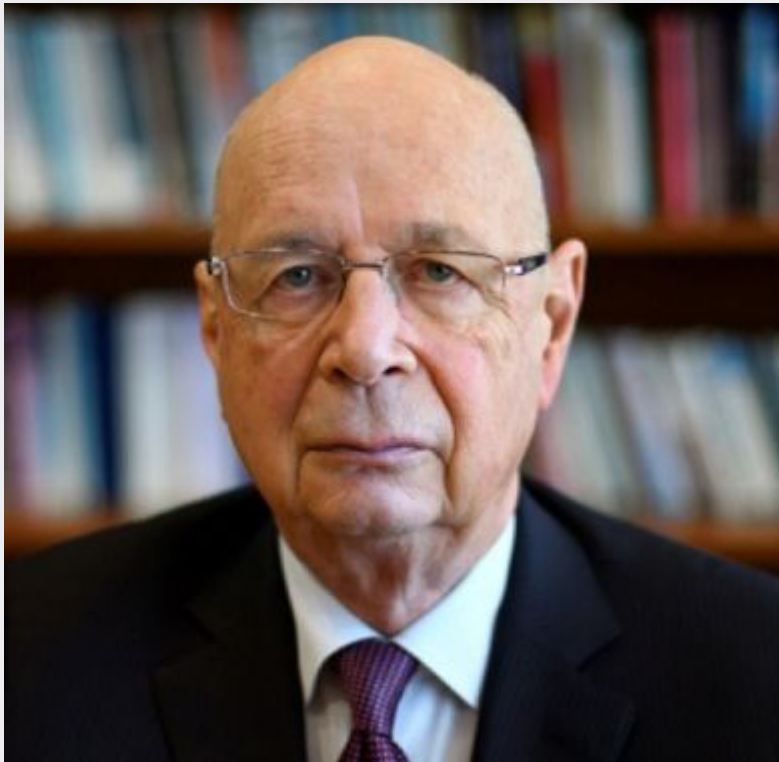
17. Kristalina Georgeva , directrice générale, Fonds monétaire international (FMI) ·