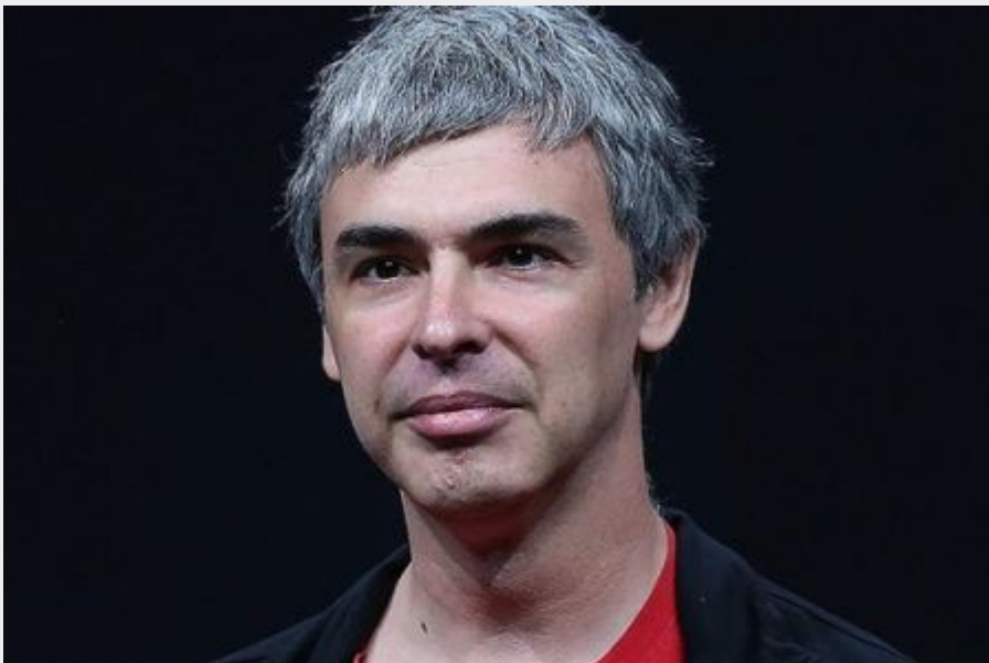
20. Laurence D Fink , présidente et chef de la direction de BlackRock .