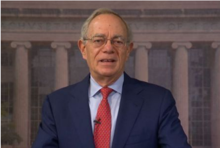
19. Larry Page , Google .