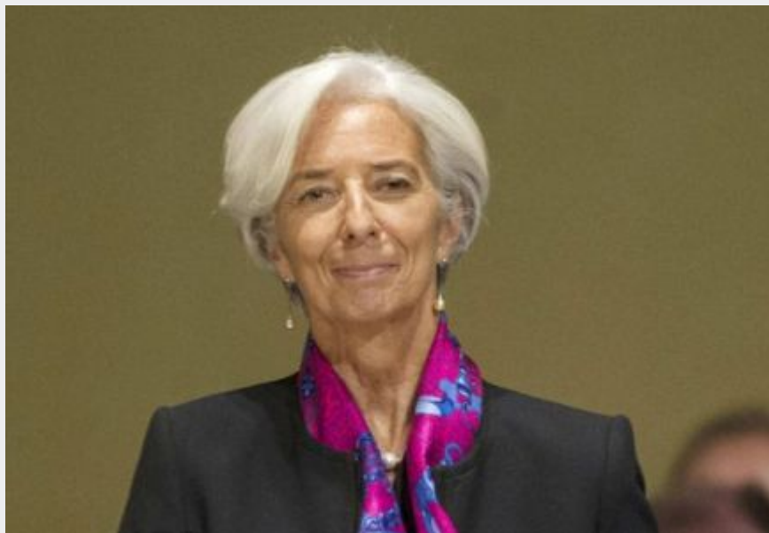
6. Chrystia Freeland , vice-premier ministre et ministre des Finances, cabinet du vice-premier ministre du Canada .