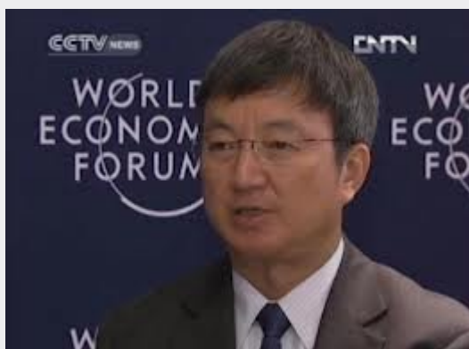
36. Zhu Min , président de l'Institut national chinois de recherche financière .