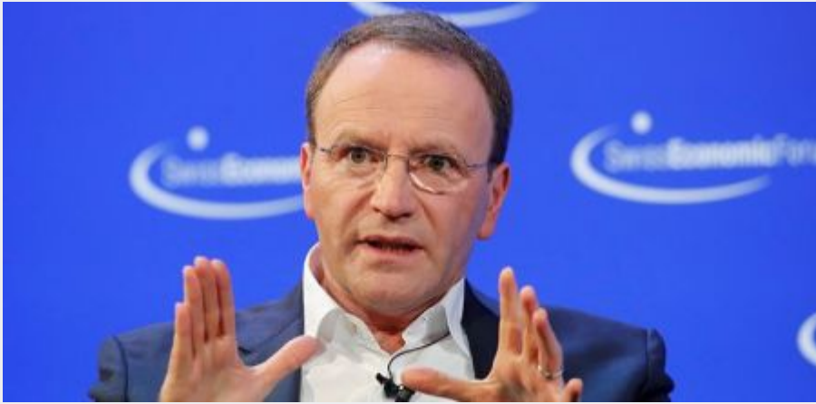
25. Mark Zuckerberg , Facebook ·