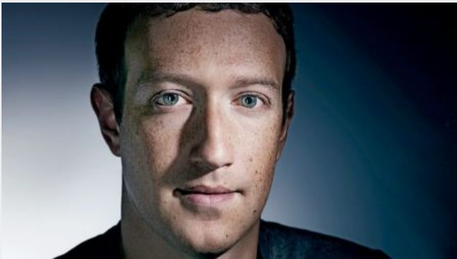
26. Mukesh D Ambani , président et directeur général de Reliance Industries ·