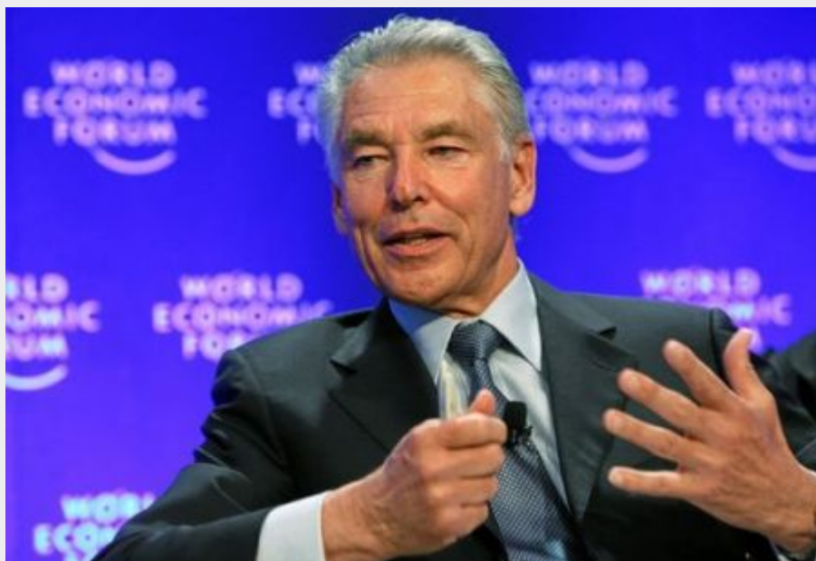
31. Peter Maurer , président du Comité international de la Croix-Rouge (CICR) ·