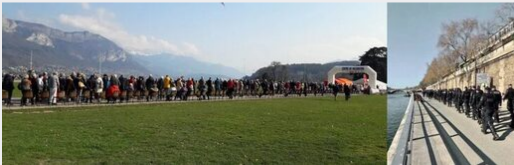
« Vaccination-évacuation », vaccinodrome d'Annecy et quais de Paris.

Le régime totalitaire vise « la domination totale » – cf. H. Arendt – , c'est-à-dire s'immisce dans la totalité des sphères sociales, privées et intimes, jusqu'au psychisme des individus. Pour y voir clair, il me semble impératif là encore de convoquer la psychopathologie. Un individu, ou un groupe d'individus, peut représenter et cristalliser l'expression de la paranoïa collective, dont l'essence est contagieuse, comme dans les sectes [18].