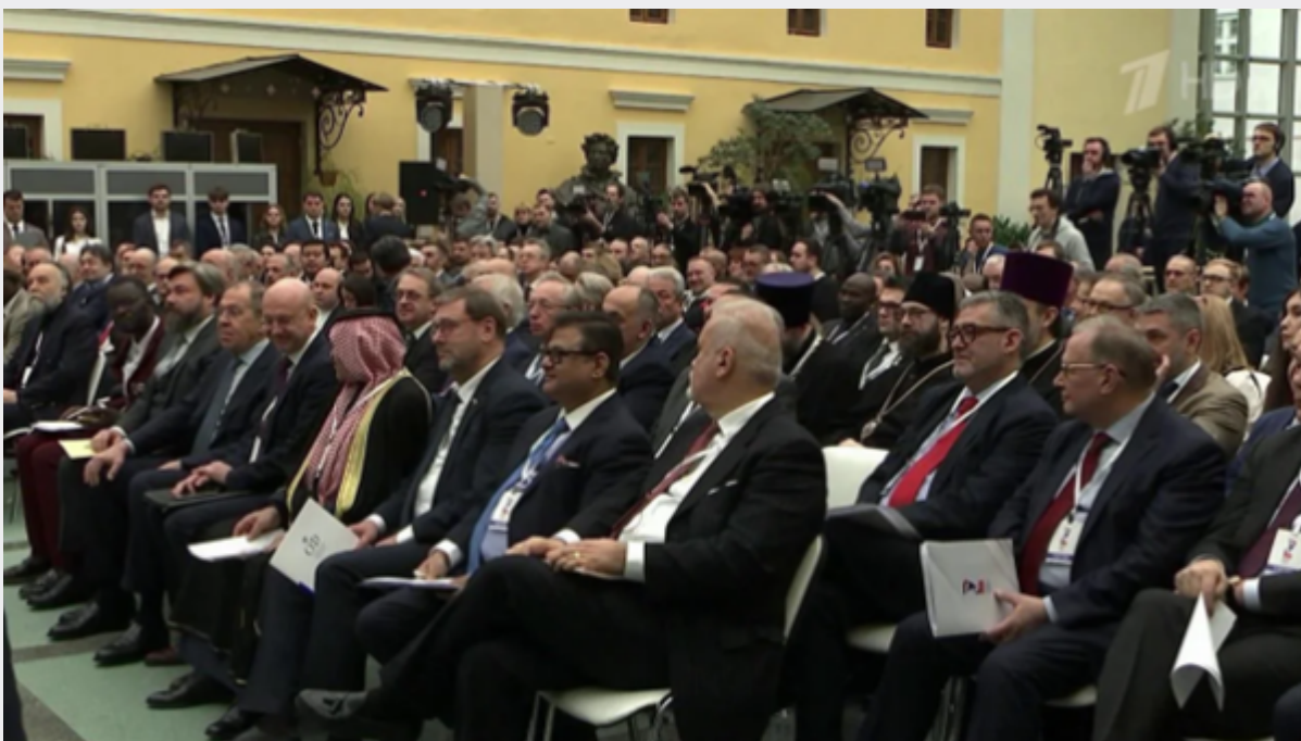
Une partie de l'auditoire au Congrès

« Le fait de vous être déplacés à Moscou à un moment si tendu mérite le plus profond respect. C'est, aujourd'hui, un véritable acte de courage. C'est précisément comme cela que les dirigeants du monde occidental apprécient ce genre d'événement, comme un défi à leur hégémonie, et pas seulement à l'ordre mondial qu'ils tentent, de toutes leurs forces, de rendre de nouveau unipolaire, mais également comme un défi aux valeurs que les dirigeants du monde occidental actuel veulent grossièrement imposer par la force dans la vie quotidienne au sein des nations, des sociétés. Ils refusent même, dans certains cas, aux familles le droit d'élever leurs propres enfants ».