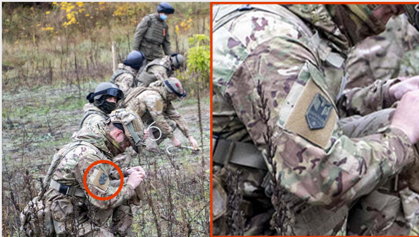
Soldat arborant un écusson du régiment Azov au cours d'un entraînement dispensé par des militaires canadiens en Ukraine en 2020.

Autre élément gênant, sur une autre photo de la formation publiée cette fois par les forces canadiennes : un homme arbore un écusson de la division de la Waffen SS «Galicie», formée en 1943 avec des Ukrainiens, et dont la mémoire est encore célébrée de nos jours par des militants d'extrême droite dans le pays. Gêné par un de ces hommages, le président Volodymyr Zelensky et les autorités ukrainiennes avaient dû condamner cette pratique en 2021 en rappelant que l'utilisation de symboles du nazisme est interdite en Ukraine.