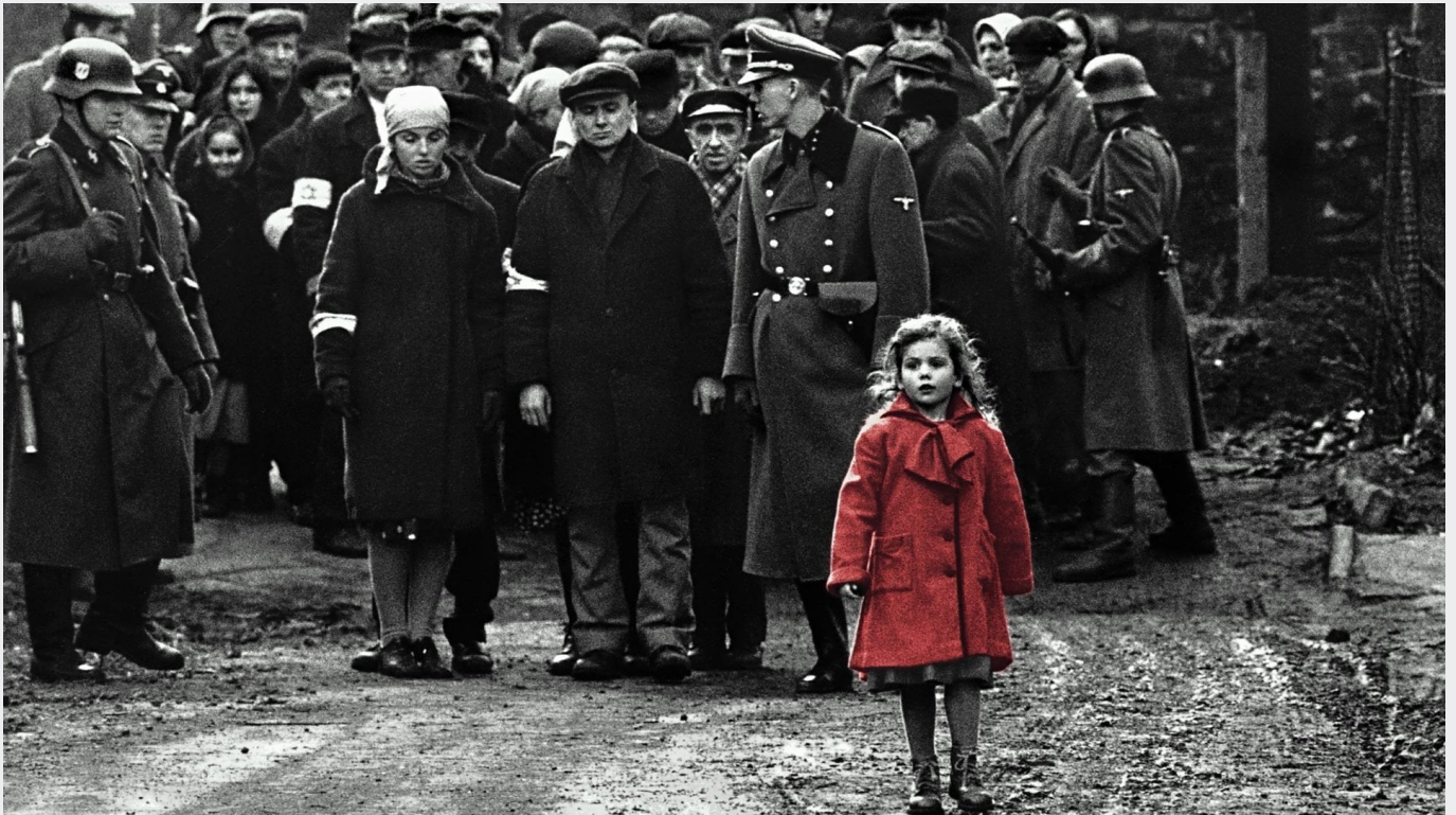
La liste de Schindler – film 1993 – Steven Spielberg ... top250.fr

Le caractère de cette «nouvelle normalité totalitaire» est, à ce stade, indubitablement clair ... si clair que la plupart des gens ne peuvent pas le voir, parce que leur esprit n'est pas prêt à l'accepter, donc ils ne le reconnaissent pas, bien qu'il soit sous leur nez. Comme Dolores dans la série Westworld, « cela ne ressemble à rien » pour eux. Pour le reste d'entre nous, cela semble plutôt totalitaire.