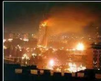
What Yugoslavia thinks I do