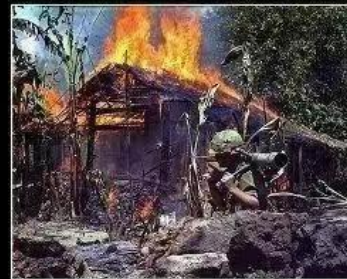
What Vietnam thinks I do