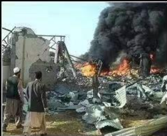
What Iraq thinks I do