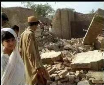
What Afghanistan thinks I do