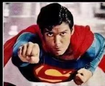
What I think I do