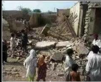
What Pakistan thinks I do