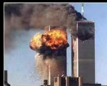
What I actually do