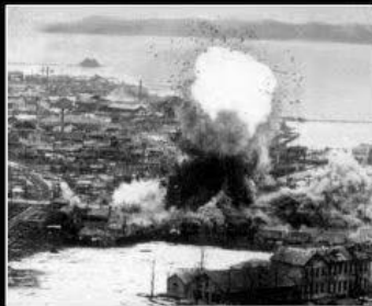
What Korea thinks I do