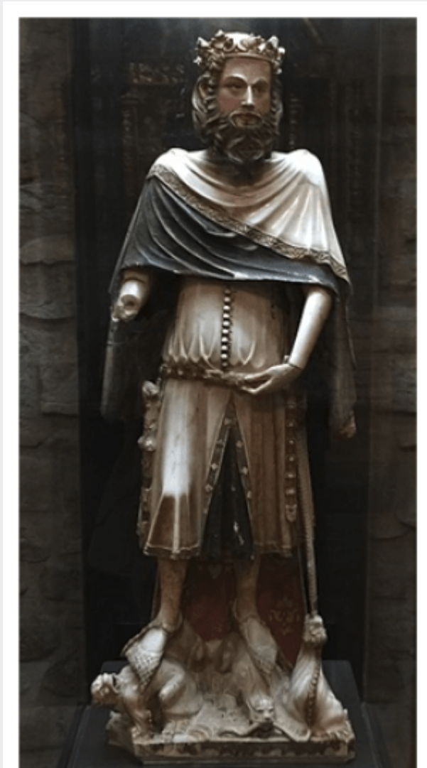
Charly dans toute sa splendeur.

nazi. Nous sommes en plein dans la logique de l'oubli de l'histoire. Quand est-ce que Google pourra nous diriger vers des informations concernant le IVème Reich, celui qui prend corps aujourd'hui ?