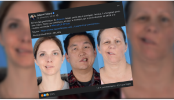
(Vidéo 16 min)

L'avocat Me Etienne Boittin a plus de 20 dossiers de décès après la vaccination anti-Covid