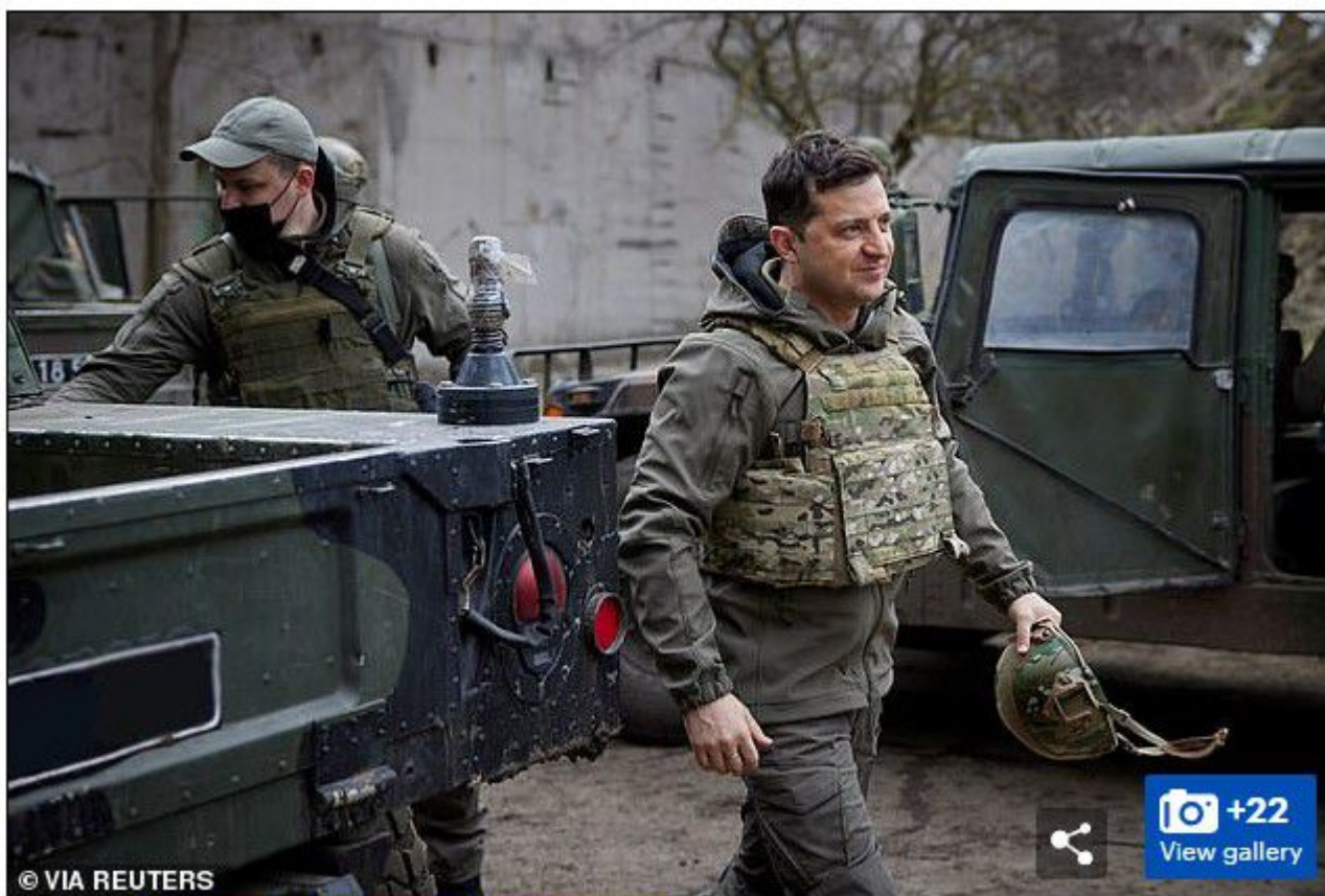
Ukraine's President Volodymyr Zelenskiy visits positions of armed forces near the frontline with Russian-backed separatists in Donbass region, Ukraine, April 9

Mais le problème, c'est que les photos datent toutes de près d'un an et ont été prises lors de sa visite aux troupes en avril dernier :